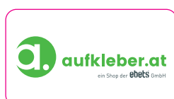
rechteckig 32x18mm 2mm Eckradius